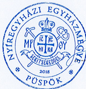
Szocska A. Ábel megyéspüspök